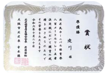
笑顔で走った証！来年もがんばろぞ！