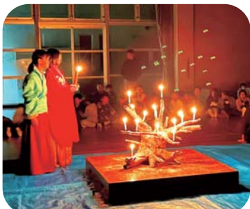
キャンドルの灯が心をつなぐ特別な夜！