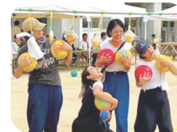
真剣だけど爆笑！大人も全力で楽しもう！