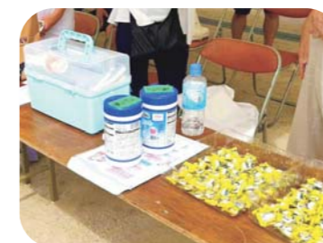
万が一にも備えて救護体制バッチリ！