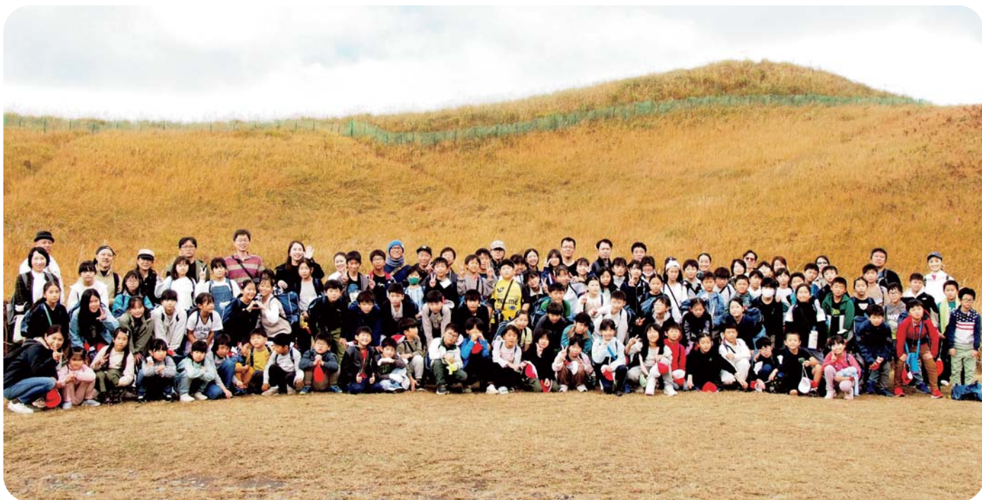
スキに囲まれてみんなでハイチーズ！仲間と過ごした特別な時間をバシバリ