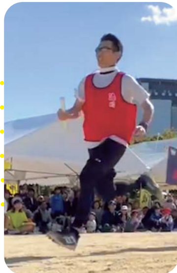
全力で走る選手たち！