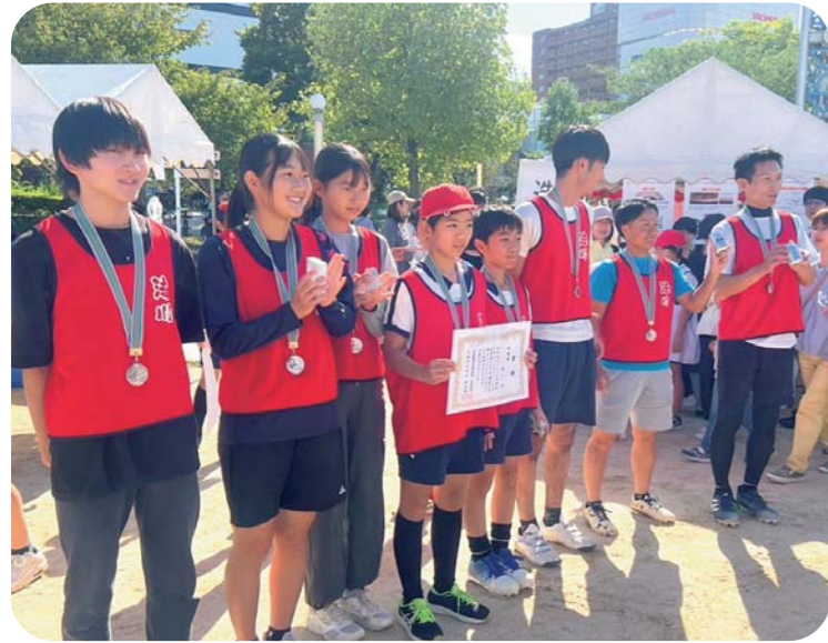
次こそは優勝を！ みんなで掴んだ準備優勝！