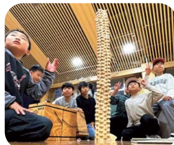
雨でも大丈夫！室内で全力チャレンジ！