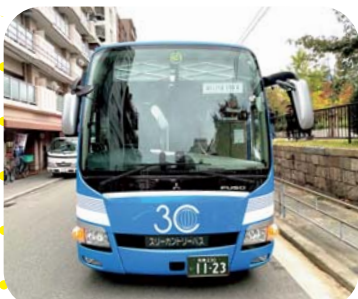
ワクワクの旅！滝川公園から出発！