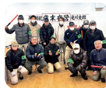
夜まわり出発前の集合写真！