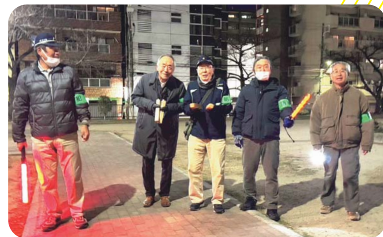
「火の用心」の掛け声と共に、寒い夜でも街の安全をしっかり見守る