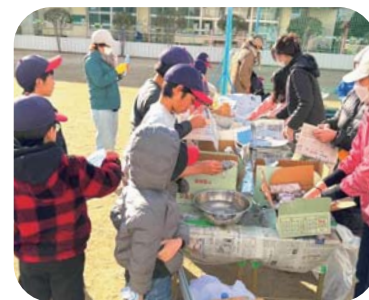
甘くて美味しい焼き芋を心を込めて準備！