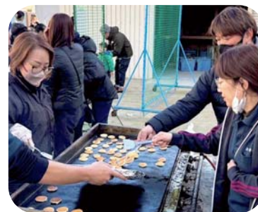
大人気のミニバンケーキ！フル稼働中！