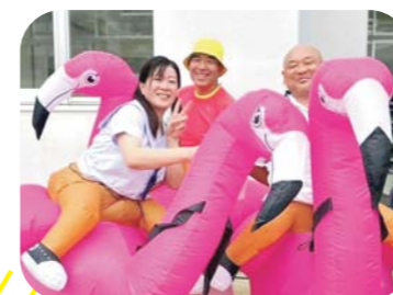
笑いと元気を届ける名司会者たち！