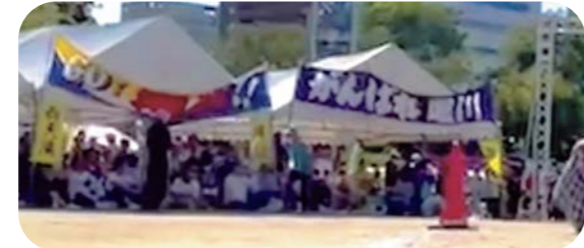
滝川応援テントの前には、大きな横断幕が