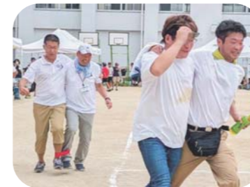
校長先生&PTA会長、全力疾走中！