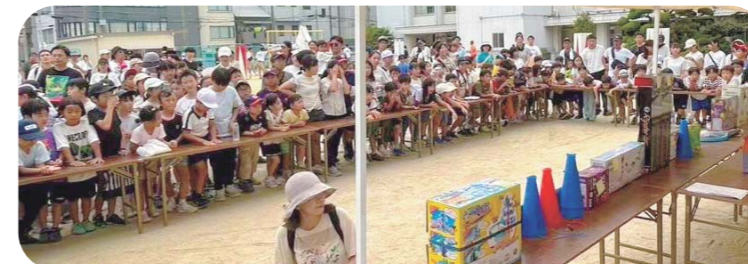
景品の山に視線集中！みんなドキドキ抽選会！

2024年9月15日、曇り空の下、滝川地域恒例の「スポーツカーニバル」が開催されました。幼児たちは親子で微笑ましい笑顔が溢れる「めくってそろえよう！」挑戦。小学生たちは徒競走で全力を尽くし、綱引きでは真剣勝負で会場が熱気に包まれました。パン食い競争では子どもも大人も夢中になり、玉入れや大玉送りでは世代を超えたチームワークが光りました。参加者全員が存分に楽しむ姿が印象的でした。フィナーレの抽選会では歓声が響き渡り、地域全体が温かな一体感に包まれました。2025年、あなたもこの輪に加わりませんか？