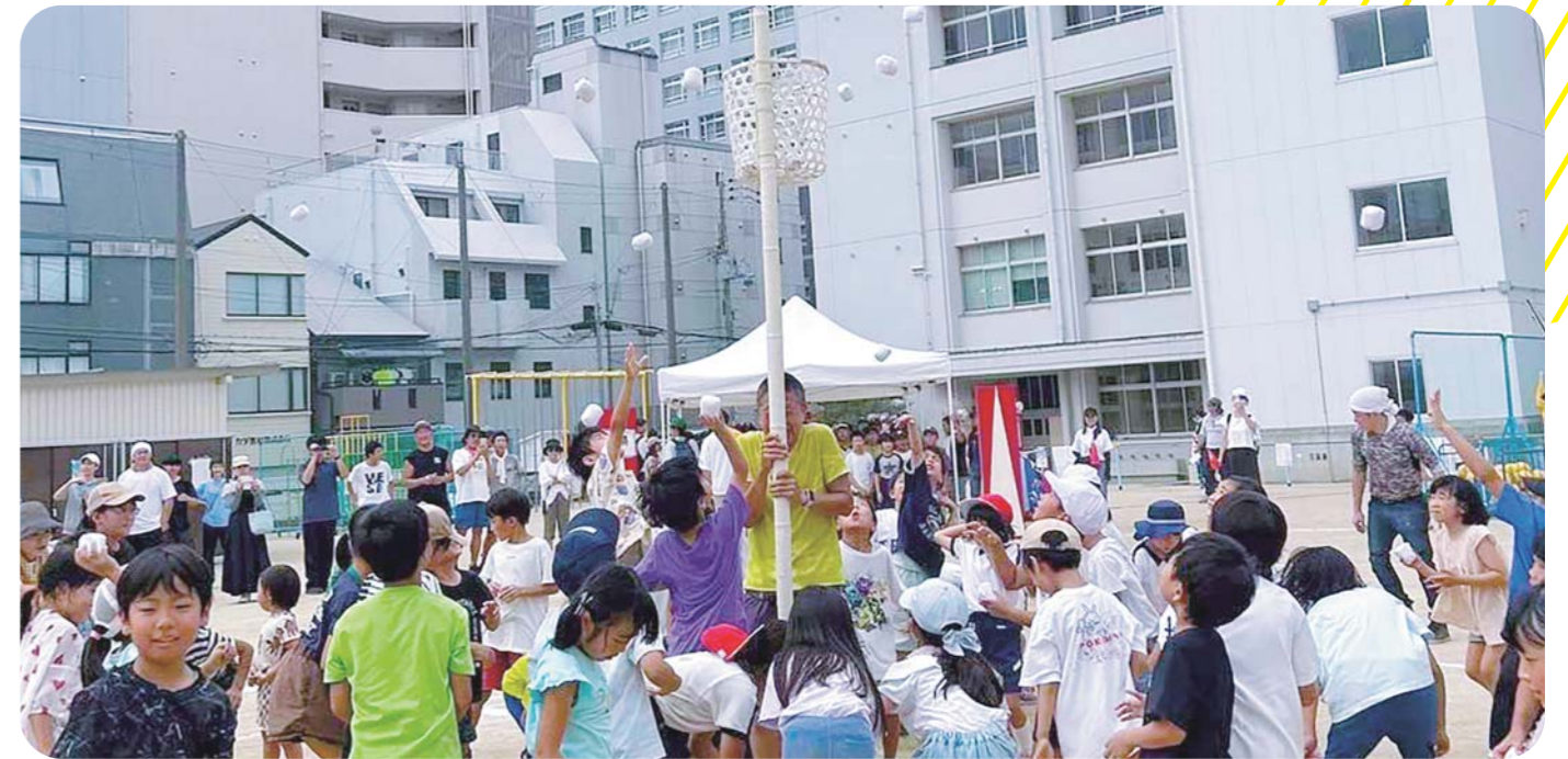
あと少し！カゴめがけて全力シュート！最後まで諦めるな！