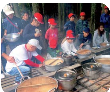
協力して作ったカレーの味は格別！