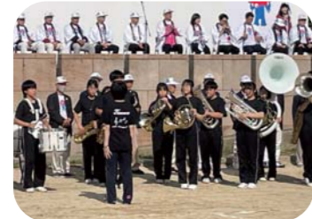
吹奏楽の演奏でテンションMAX