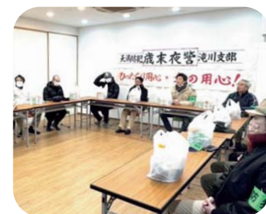
安全を守るため、みんなで打ち合わせ中！