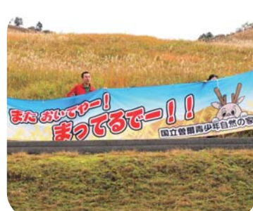
また来たー！最高のお校外キャンプでした！