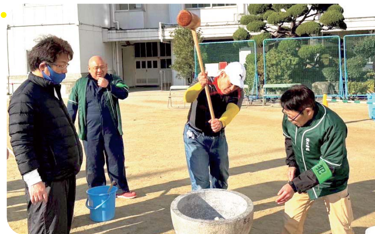
地域の手で作る最高のお餅が完成！